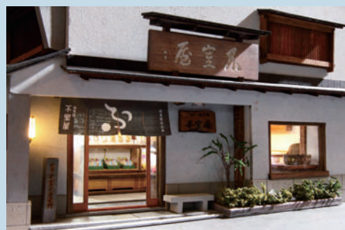
「加賀麩 不室屋尾張町店」(金沢市尾張町) 制作: 小幡耕一

そのほかにも株式会社俵屋(金沢市小橋町)、 近江町市場店舗(ヤマカ水産新通り店・すゞめ 近江町市場店)、 浅野川友禅流しも!