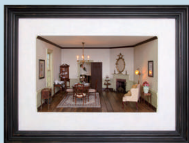
「ジョージアン・ダイニング」 制作: 木村浩之・美海きょうこ

ドールハウスの歴史は古く、17世紀のヨーロッパで貴族の婦人や豊かな商人が小さな宝物のコレクションを飾るためにミニチュアサイズの建物や部屋の中に家具や道具などを並べたのが始まりとされています。サイズは1/12が標準サイズで、1/24サイズや1/144サイズなどもあります。