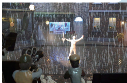
「Singin' in the Rain」 制作: 小幡耕一

この作品は、最新の映像技術により、ドールハウスの中に入り、流れる音楽と共に自由に動き回ることができます。