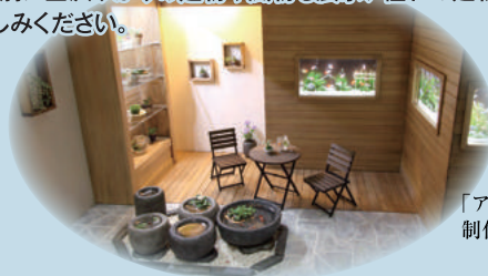
「アクアリウムラウンジ」 制作: 小林美幸

本展では日本で活躍する7人のミニチュアドールハウス作家の作品約80点を展示し、それぞれの世界観で精巧、精密に作られた作品をご覧ください。今回特別に金沢ゆかりの建物や風物も展示、憧れの建物、懐かしい商店など小さいながらも大きく夢の広がる世界をお楽しみください。