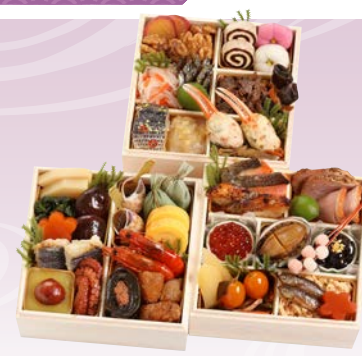
C-1106 和風ミニ三段重 (監修) (和風ミニ三段、2人前、15.7×15.7×15cm)..... 13,500円 小麦 卵 乳 エビ カニ くるみ