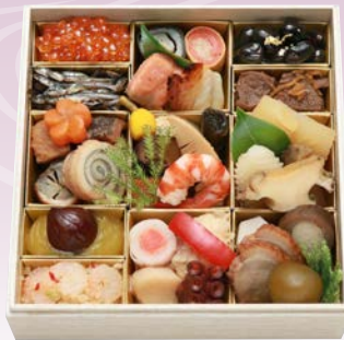
C-1113 おせち料理 (和風一段、1人前、20×20×6cm)..... 10台限定 15,120円 小麦 卵 エビ

京料理を代表する料亭として、茶道の両千家や文豪・谷崎潤一郎など、多くの著名人に愛された伝統の味わいを今に伝えています。