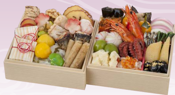
C-1111 和風おせち 二段 (監修) (和風二段、1~2人前、14.5×14.5×8cm)..... 11,800円 小麦 卵 乳 エビ カニ