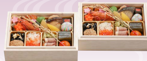
C-1101 銘々おせちミニ二段重 (監修) (和風二段、1人前×2客、14.7×20.6×10cm)..... 60台限定 15,120円 小麦 卵 乳 エビ