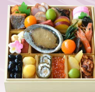
C-1103 福おせち和風一段重 (和風一段、2人前、20.2×20.2×5.7cm)..... 11,880円 小麦 卵 乳 エビ くるみ