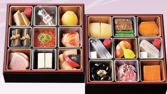
C-1110 和二段重 (和風二段、1~2人前、15.7×15.7×10.8cm)..... 10台限定 19,440円 小麦 卵 乳 エビ