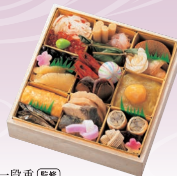
C-1102 和風一段重 (監修) (和風一段、1~2人前、15.5×15.5×4cm)..... 16,200円 小麦 卵 乳 エビ