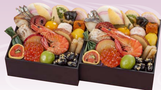
C-1112 和風おせち 個食重 (監修) (和風二段、2人前、14×14×9cm)..... 12,420円 小麦 卵 乳 エビ カニ

京都・妙心寺御用達の京料理店「花ごころ」が贈る、自慢の美味をコンパクトに盛り付けました。