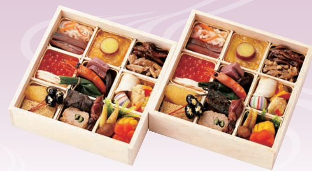
C-1109 おせち料理二人重 (監修) (和風二段、2人前、16.5×16.5×9cm)..... 19,440円 小麦 卵 乳 エビ カニ