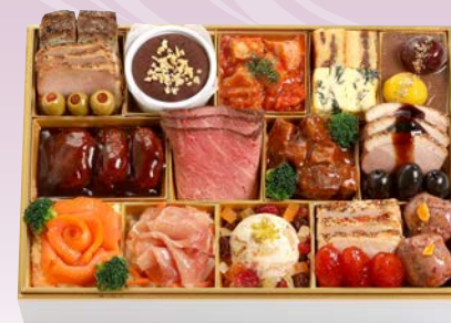
C-1107 洋風一段 (監修) (洋風一段、2人前、20.2×29.6×5.4cm)..... 13,500円 小麦 卵 乳 エビ カニ