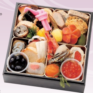
C-1115 おせち料理 (和風一段、1人前、16.5×16.5×4.6cm)..... 12,960円 小麦 卵 乳 エビ

地元のお客様に愛される京都・乙訓の老舗料理屋。基本的な祝い物をすべて献立に入れ、自家製手作りの味を大切に、盛り込みによる盛りつけの美しさにもこだわっております。