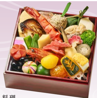
C-1116 おせち料理 (和風一段、1人前、15.5×15.5×5cm)..... 16,200円 小麦 卵 エビ