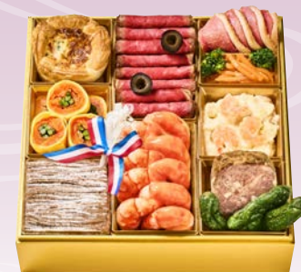
C-1108 京乃百年洋食東洋亭 洋一段 (洋風一段、2人前、21.5×21.5×5.3cm)..... 13,500円 小麦 卵 乳 エビ