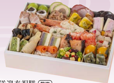
C-1104 和洋迎春祝膳 (監修) (和洋一段、2人前、19.5×25.5×5.5cm)..... 10,584円 小麦 卵 乳 エビ カニ

加賀の月うさぎ伝説にゆかりの観光名所にておもてなしをするお食事処。和洋の美味を彩り華やかに取り揃え、迎春用の祝膳に仕上げました。