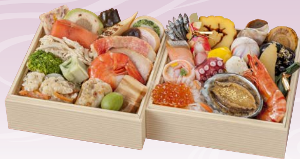
C-1114 おせち料理 (監修) (和洋二段、1人前、14.5×14.5×8cm)..... 11,448円 小麦 卵 乳 エビ カニ