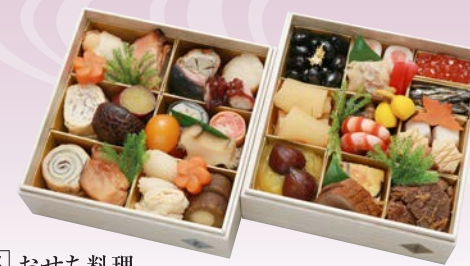
C-1105 おせち料理 (和風二段、2人前、17×17×12cm)..... 2台限定 24,840円 小麦 卵 エビ

京料理を代表する「たん熊北店」の流れをくむ名店。繊細な味わいと四季の風趣を凝らす伝統の京料理が人気です。